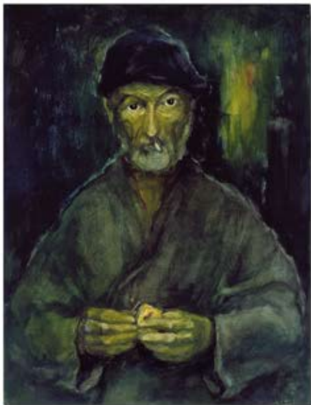
Le Clochard (autoportrait), 1977 - Cat.# 2979

Au prieuré de Trégoux (Lot) - Ouvert sur rendez-vous